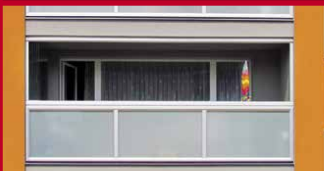
hlinikové zábradlie ELOX