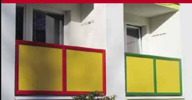
hlinikové zábradlie vo farbe