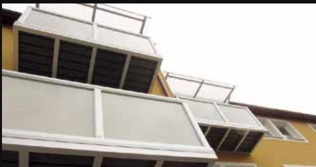
hlinikový závesný balkón