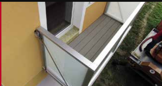
hlinikový závesný balkón – podlaha