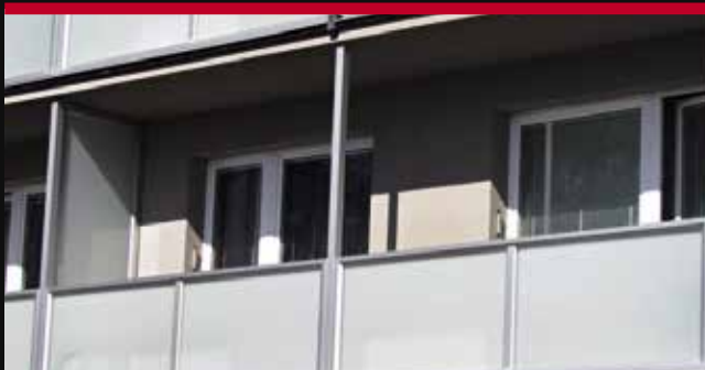
hliniková deliaca stena