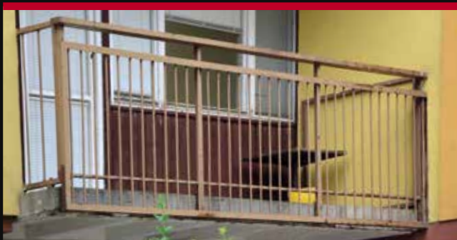
oceľové zábradlie pred rekonštrukciou