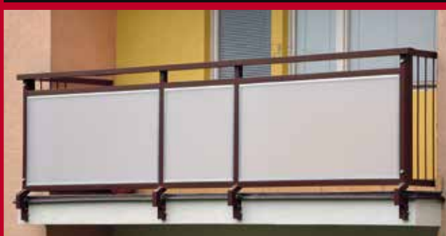
oceľové zábradlie po rekonštrukcii