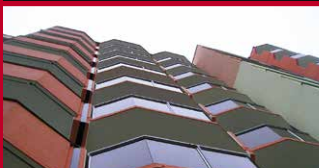
uhľové oceľové zábradlie